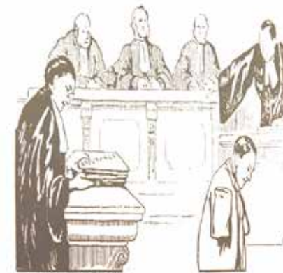
Devant le Tribunal Civil. Application de la loi 1898. LA DÉCEPTION

Salle Guy Debever Faculté des Sciences Juridiques, Politiques et Sociales 1 place Delécluse, 59000 Lille Métro Porte de Douai Contact : rathalie.flament@univ-lille2.fr