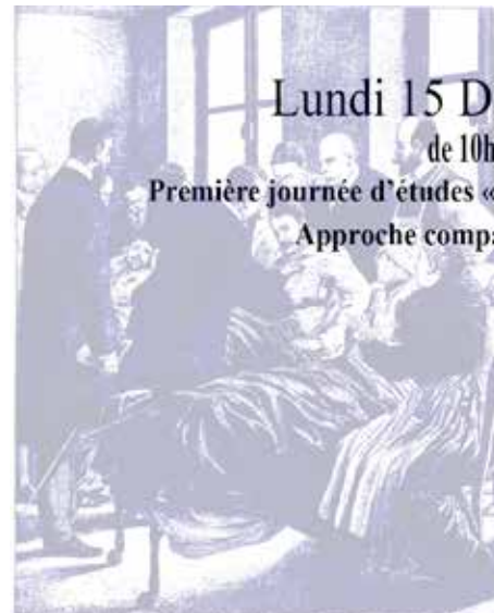
LES SURVIVANTS DE LA CATASTROPHE DE COURRIÈRES Peinture de Jean-Louis Lemaire (1898) (Musée de la Ville de Lille)

ADMINISTRATION ET RÉDACTION FÉDÉRATION NATIONALE DES MUTILÉS ET INVALIDES DU TRAVAIL BOURSE DU TRAVAIL — SAINT-ÉTIENNE (LOIRE)