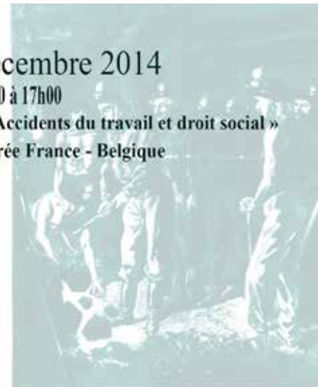
Le Travailleur de la République aux mines de Lens