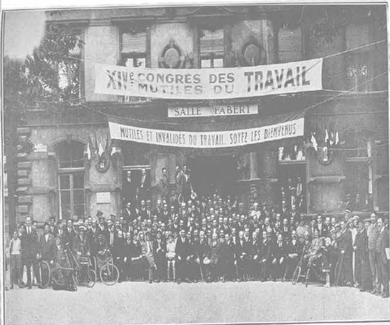
XIV e Congrès National de Metz (Juin 1935). — Le groupe des Délégués.